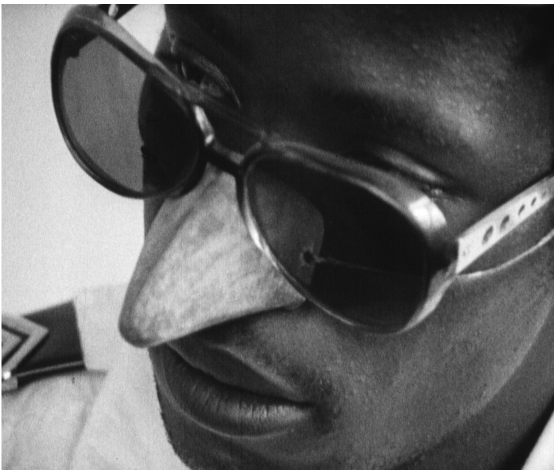
Mueda, Memória e Massacre, 1979-80. Ruy Guerra