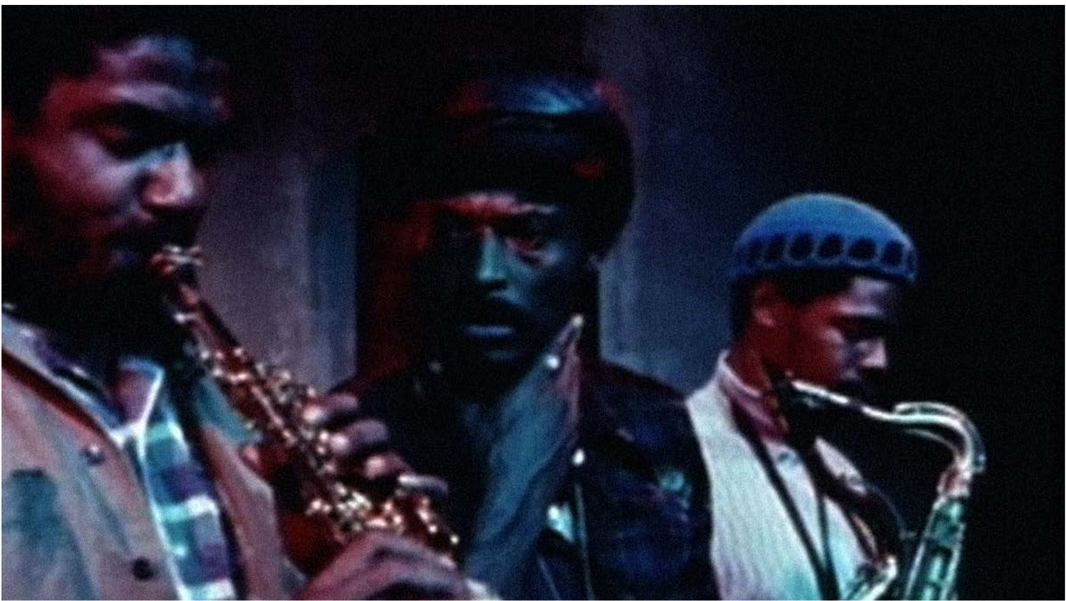
Passing Through , 1977. Larry Clark