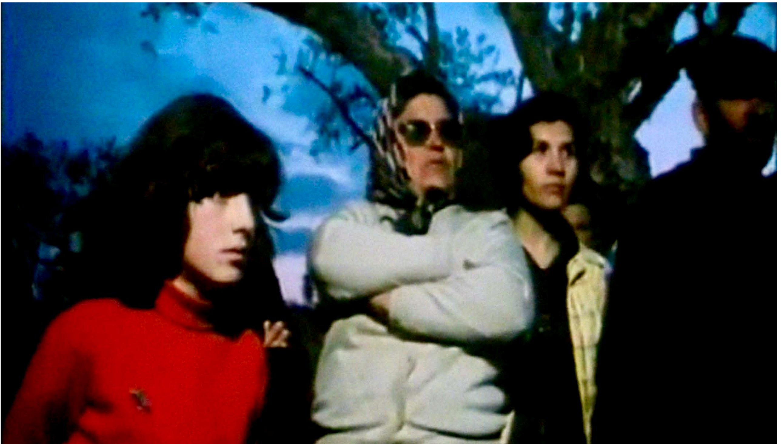
Torre Bela , 1977. Thomas Harlan