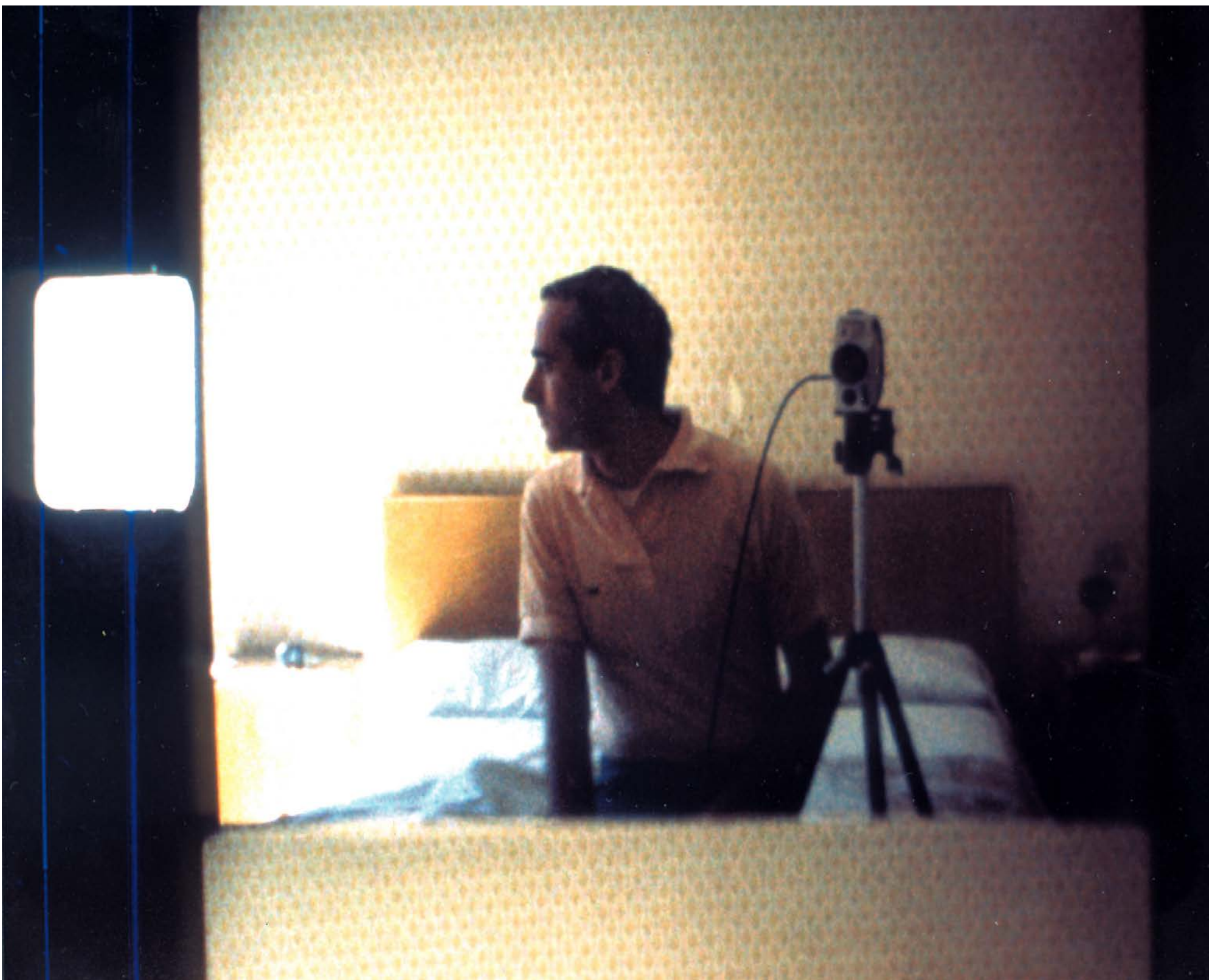
Les Antiquités de Rome , 1989. Jean-Claude Rousseau