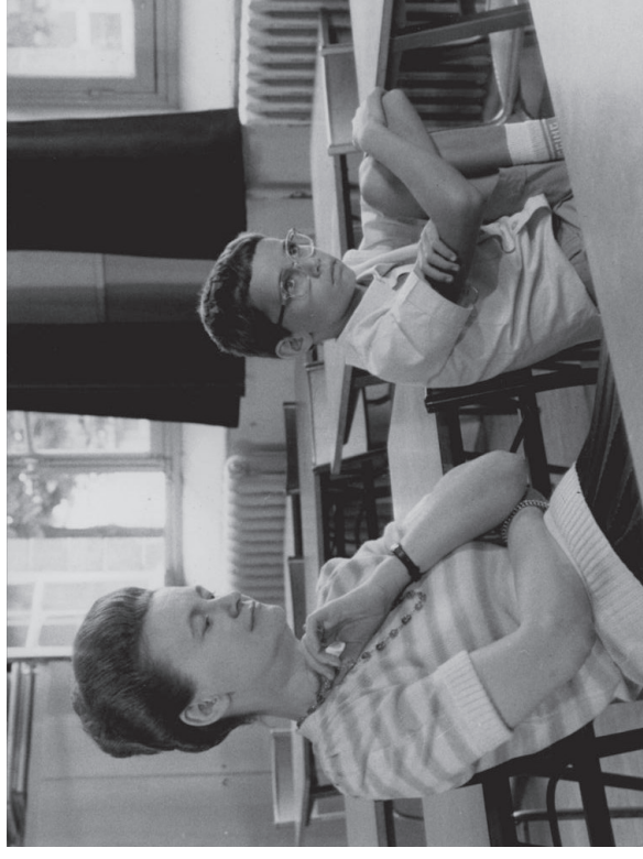
En rachâchant , 1982. Jean-Marie Straub i Danièle Huillet