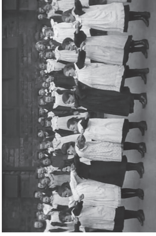
Audley Range School , Blackburn, 1904. Mitchell & Kenyon