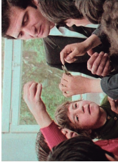
Diario di un maestro , 1973. Vittorio De Seta