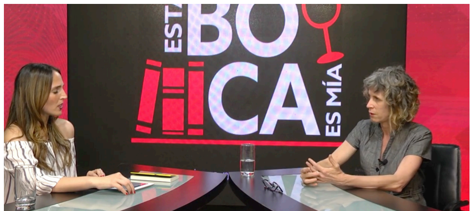
Nona Fernández - «Me interesa traducir los dolores de la sociedad» (10:00 - 11:44)