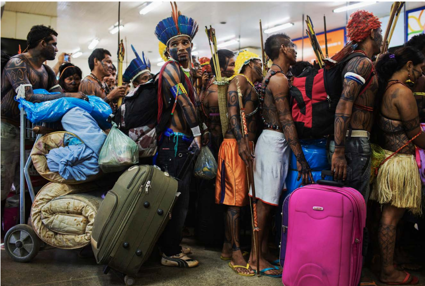
Lalo de Almeida, Protesta dels munduruku a Belo Monte, 2013. Cortesia de l'artista.

Si en l'economia, bonanza vol dir 'benefici econòmic i inversió de diners, per a l'Amazònia significa la seva destrucció ecològica. I, per a la població, l'obligació de marxar de la seva terra.