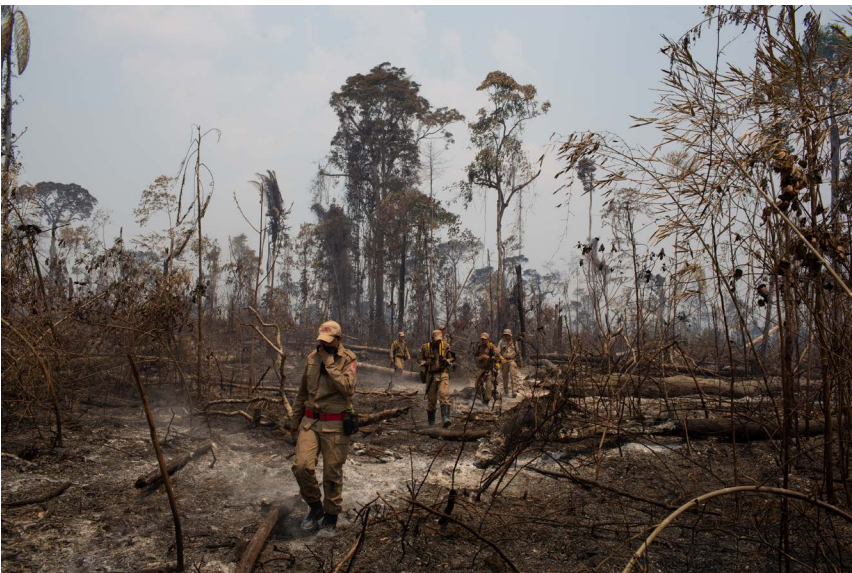
Víctor Moriyama, Floresta queimada, 2019. Cortesia de l'artista.