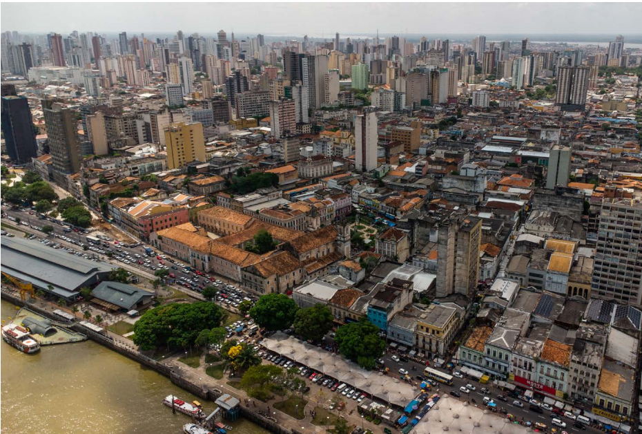
Andrés Cardona, Vista aèria de Belém do Pará , 2023.

A les ciutats que es troben al voltant del riu, com Leticia, Iquitos, Manaus, Belém do Pará i Rio Branco, existeixen moviments culturals que reivindiquen aquest canvi.