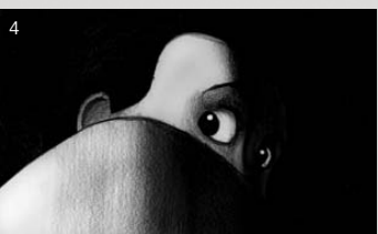
4. Peur(s) du noir / VVAA