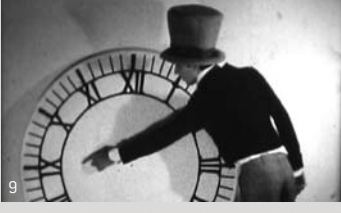
8. Pneurosis en el baño / Daniela Cugliandolo 9. Alicia, Lewis Carroll y el tiempo / Daniela Cugliandolo

Pantalles al Hall del CCCB: Scopitone Maratò S-8 Open Screen Convitats especials: Mobileskino (Suïssa) Los Superocheros (Holanda)