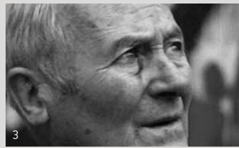
3. Miro, l'altre / Pere Portabella