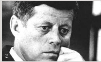
1. Respite / Harun Farocki 2. Crisis / Robert Drew