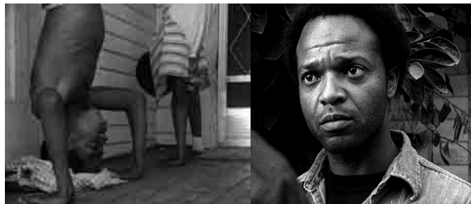
Killer of Sheep , Charles Burnett

Programadors: Núria Esquerri i Gonzalo de Lucas.