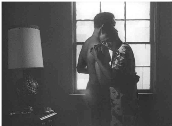
Killer of Sheep , Charles Burnett

El 1990, Killer of Sheep va ser seleccionada per la Biblioteca del Congrés com un dels primers 50 títols a entrar al Registre de Cinematografia Nacional. Tot i que va tenir anteriorment una carrera comercial força reeixida a Nova York aquell any, la seva aproximació al tema és més lírica i reflexiva que dinàmica i dramàtica, i no va ser un èxit.