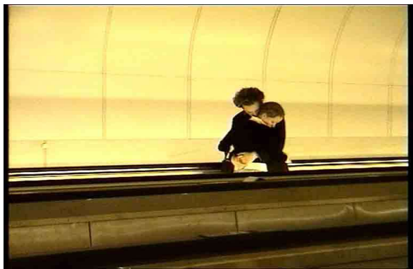
Chats Perchés, Chris Marker

(1) Agència de telègrafs russa, per a la qual els constructivistes van fer cartells, van il·lustrar telegrames o van decorar aparadors entre el 1919 i el 1921.