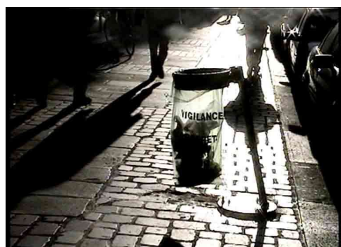
Chats Perchés, Chris Marker

[...] Estava, doncs, allà, en aquella situació. Tenia davant una hora d'imatges. Tenia alguns elements sobre els temps a partir de les imatges, coneixia la durada dels diferents fragments. En el meu cap, sabia que fins que apareguessin les primeres imatges del Mur filmaria aquell espai. Després filmaria el Mur i tota aquella part. Després em posaria davant de la càmera. No m'aturaria fins que escoltés (el dispositiu no em permetia veure el televisor) el començament d'un altre rodatge: era el meu senyal. Tenia una vaga idea dels blocs de materials. Començo aquí, vaig cap allà. Volia que hi hagués un veritable sentiment d'improvisació, i de la possibilitat d'ofegar-se. L'última cosa era: si no tens res a dir, no ho diguis. Era ben bé així. La força d'estar allà, davant la càmera, d'estar assegut