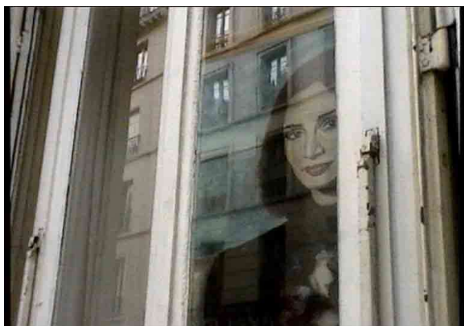
Chats Perchés, Chris Marker

Guillaume va ser un gat de veritat que em va adoptar, que va ser el meu conseller, el meu amic íntim, el meu company, el meu inseparable i l'única persona a la qual deixava estar al meu costat mentre muntava. Per la direcció de les seves orelles veia si estava d'acord o no amb el que feia. I després se'n va anar al paradís dels gats. Un temps després se'm va aparèixer en la forma d'un fantasma. Tenia moltes ganes d'intervenir i sobretot tenia idees. Al matí, quan escoltava les notícies, arribava amb una bafarada de tira còmica i era ell qui se situava així en l'actualitat. Jo no sóc més que el seu mitjà. Doctor Jeckyll i Mister Hyde. Guillaume és tot el que jo no sóc: fanfarró, intervencionista, exhibicionista, no demana sinó que es parli d'ell. Ens vam complementar perfectament.