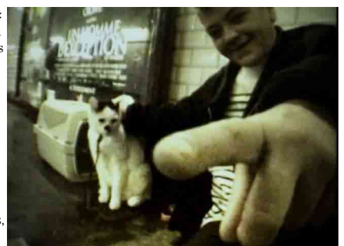
Chats Perchés, Chris Marker