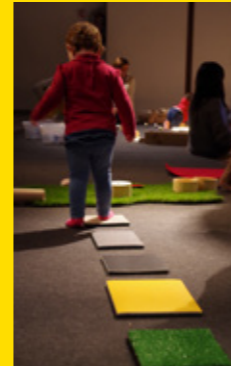
Prohibit no tocar