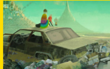
Cinema: El nen i el món