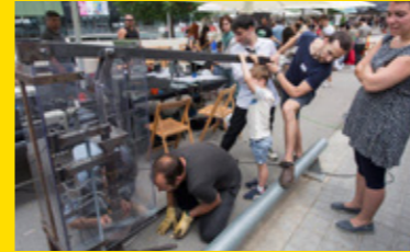
Upcycling de barri