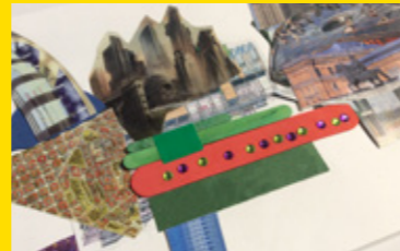
La Barcelona del futur

CCCCB Centre de Cultura Contemporània de Barcelona