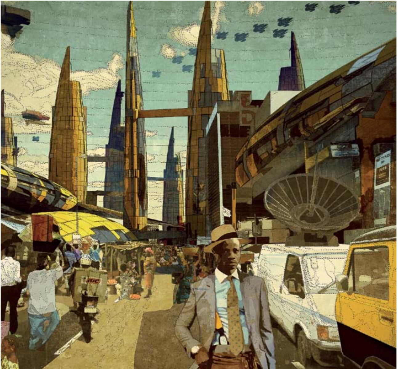
Idumota Market, Lagos 2081 A.D., 2014 © Wale Oyajide [kirejones.com]

L'afropessimisme i l'afroescepticisme subsisteixen, però l'Àfrica ha entrat al segle XXI amb la determinació de trencar les cadenes de la pobresa i buscant les eines per fer-ho. L'Àfrica és un continent divers i complex, i en molts dels seus països coincideix una nova generació que, al voltant de la cultura, i a través de la creació i del disseny més o menys aplicat o especulatiu, reivindica el seu dret a construir-se en llibertat i en contra dels estereotips i l'imaginari –en el millor dels casos, paternalista– que des del món occidental es projecta contra el continent i que suposa el més perillós dels setges. El segrest de la imatge de l'Àfrica suposa el segrest del seu futur.