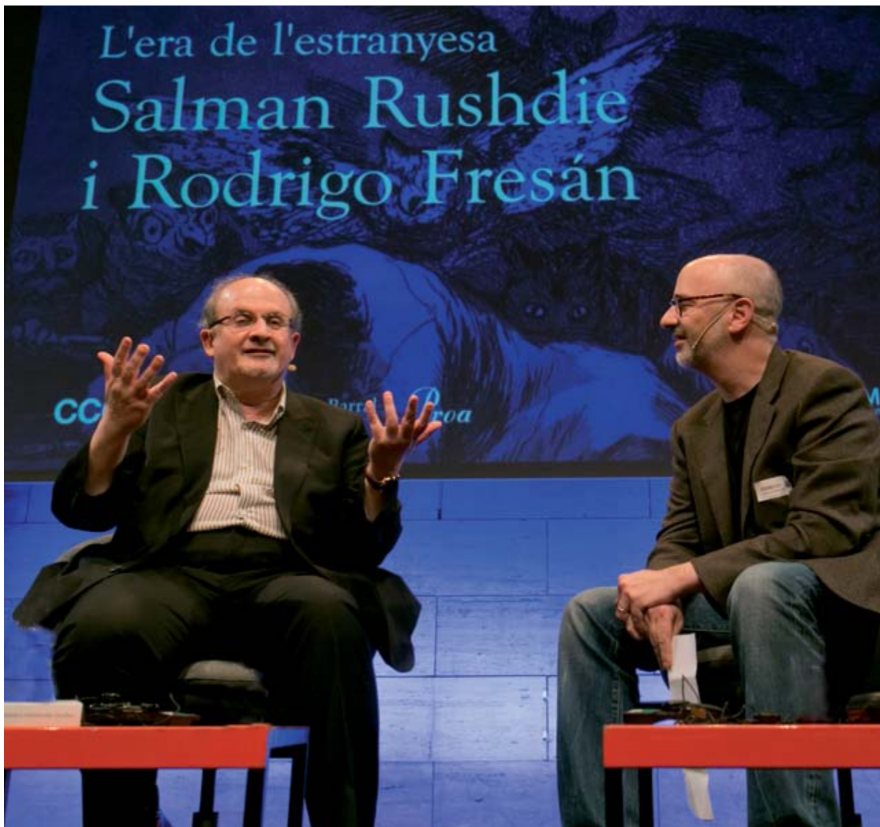
CCCB © Miquel Taverna

Kosmopolis, la festa de la literatura amplificada ha anat evolucionant en cada una de les seves edicions, barrejant gèneres i formats, explorant les fonts literàries en l'àmbit audiovisual i la paraula en les arts performatives, i, paral·lelament, abordant l'ecosistema del llibre: la transformació de l'àmbit editorial, els canvis en els hàbits de lectura i l'impacte de les tecnologies en la manera de concebre, crear i difondre literatura. El 2016 és un any de preparació de la propera edició, que a través de la programació contínua manté els vincles amb el món literari i editorial, entre edició i edició. Aquest any també incorpora una col·laboració especial amb Eurocon, el gran esdeveniment anual de la literatura de ciència ficció a Europa. Patrocinada per l'European Science Fiction Society ( esfs.info ), l'edició de 2016 tindrà com a seu principal el CCCB i se celebrarà del 4 al 6 de novembre.