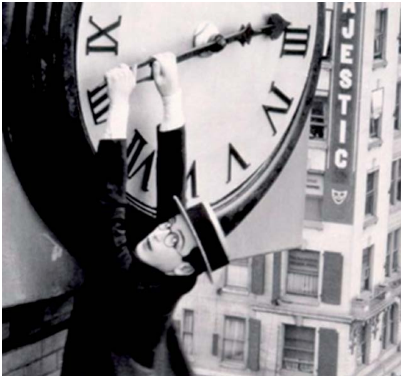
Captura del film Safety Last! , 1923

Creiem que podem dominar el temps –el passat es guarda, el present es fixa, el futur s'administra– i les tecnologies de la comunicació prometen una simultaneïtat global que sembla fer realitat els antics somnis de la humanitat. Però, a quin preu? L'evolució accelerada menysprea l'experiència de la vida, provoca nous conflictes socials i origina en les persones la por de deixar d'estar connectat. Quanta acceleració pot suportar l'ésser humà? Com es pot aconseguir una relació més raonable amb el temps per dotar les nostres vides de més sentit?