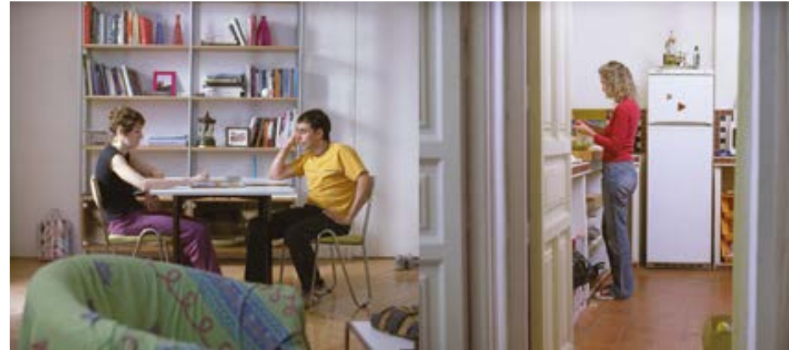
La Soledad , 2007

Samedi 3 mai, 20h, Cinéma 2, précédé du court métrage The Fish Bowl (1999, 10')