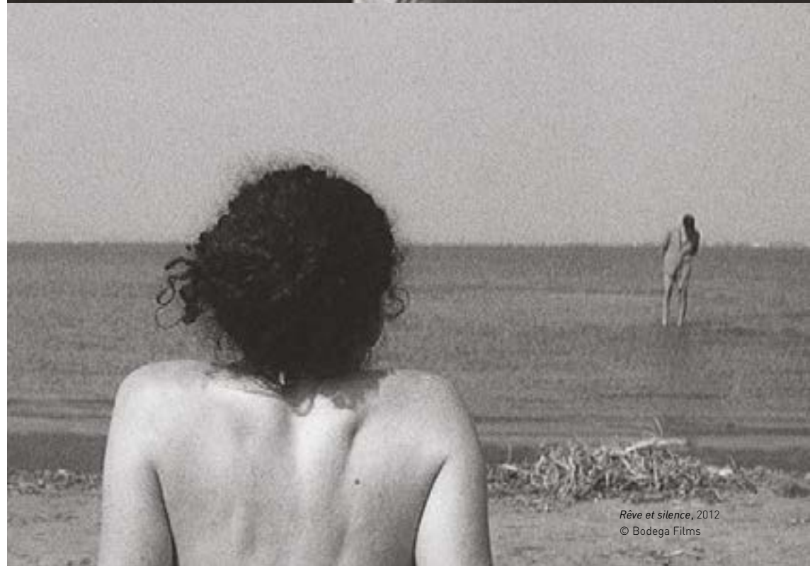
Rêve et silence , 2012