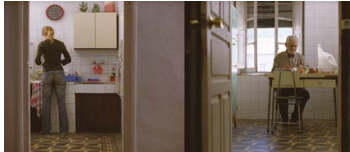
La Soledad , 2007