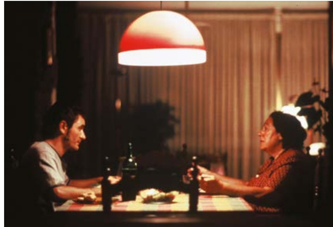
La Horas del Dia , 2003

Dimanche 11 mai, 19h, Cinéma 2, précédé du court métrage Yo tuve un cerdo llamado Rubiel (1998, 13')