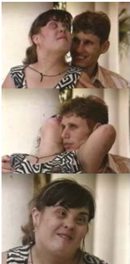
Virginia no dice mentiras, 1997

séance présentée par Jaime Rosales et Philippe Roger