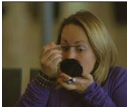
T4 - Barajas Puerta J50 , Jaime Rosales, 2009

Joana Hurtado Matheu, livret de l'édition DVD des Correspondances filmées , éd. Intermedio