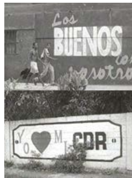
Palabras de una Revolución, 1998

Vendredi 16 mai, 20h, Cinéma 2, suivi de Rêve et Silence (2012, 110')