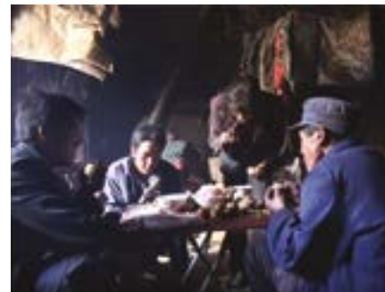
Happy Valley , Wang Bing, 2009

Tous les jours, à partir de 11h, Forum -1, accès libre