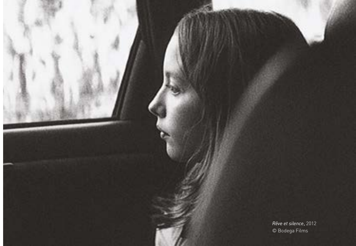
Rêve et silence , 2012

Vendredi 16 mai, 20h, Cinéma 2, précédé du court métrage Palabras de Una Revolución (1998, 11')