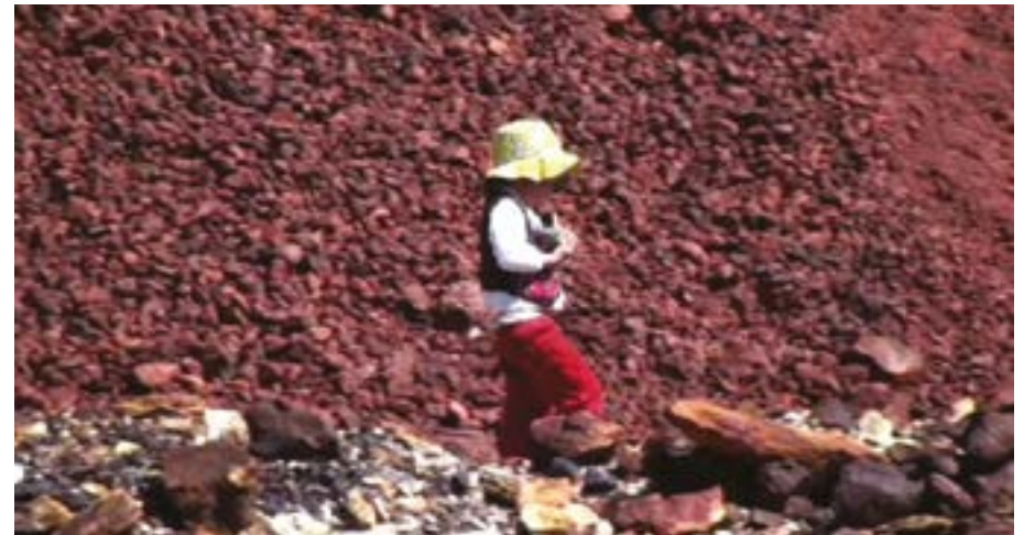
Red land , Jaime Rosales, 2012 © CCCB

Une journée quelconque à l'aéroport de Madrid. Une caméra équipée d'un téléobjectif filme le micro-devenir des passagers qui attendent, qui font quelques courses ou qui jouent à la console vidéo. Rosales nous emmène dans un aéroport, "non lieu" par excellence de la culture occidentale contemporaine, où les voyageurs et les travailleurs partagent des moments sans histoire, sans identité.