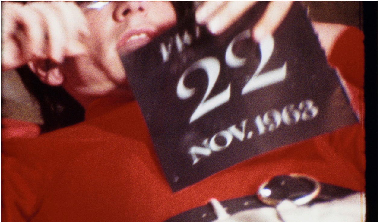
Since , Andy Warhol, 1966

© 2018 The Andy Warhol Museum, Pittsburgh, PA, a museum of Carnegie Institute.