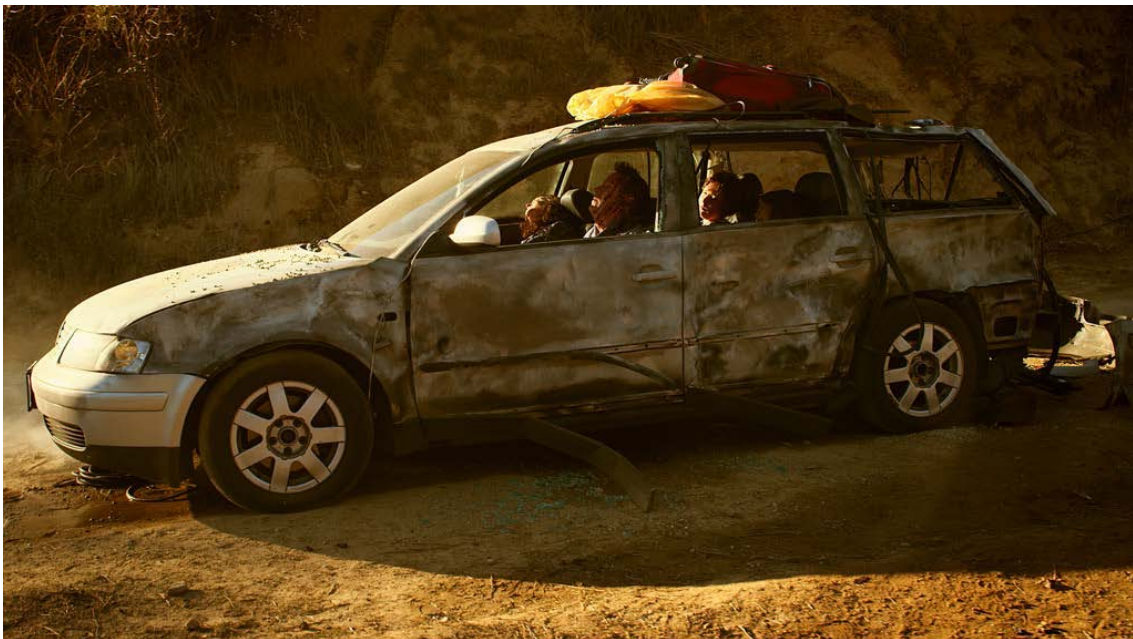
Omer Fast, Millor a mil cinc-cents metres , 2011.