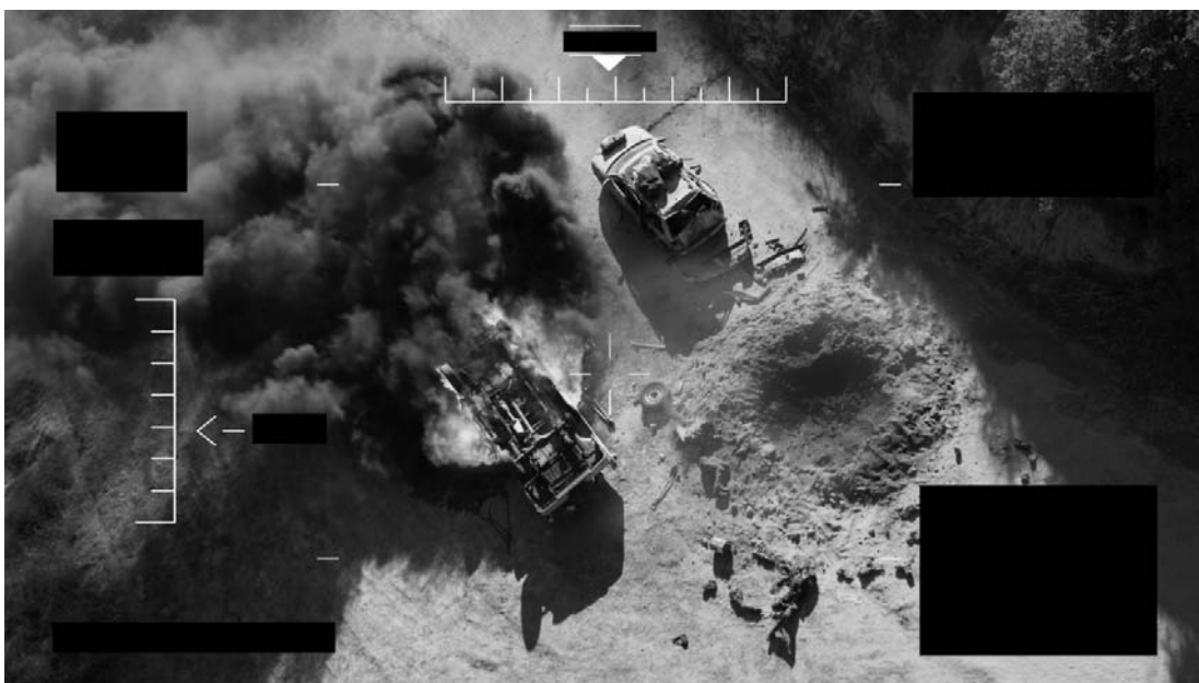
Omer Fast, Millor a mil cinc-cents metres , 2011.

Finalment, el programa de televisió realitzat des del CCCB, "Soy cámara", oferirà un resum de les reflexions dutes a terme en les diverses activitats.