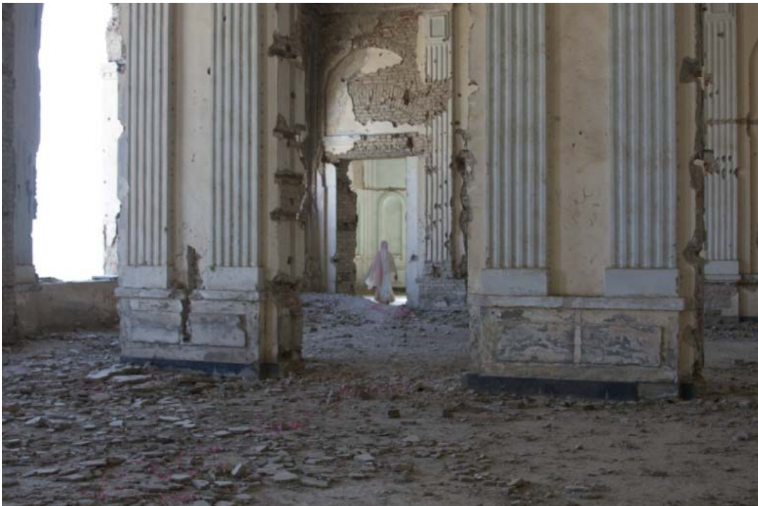
Mariam Ghani. Una breu història de ruïnes , 2011-12