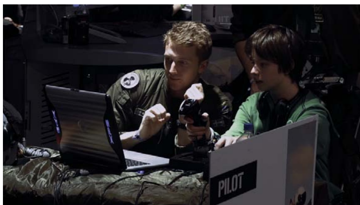
Lucian Muntean Copyright @ Flimmer Film 2014

En aquests debats, plenament vinculats a l'actualitat i a casos reals de conflictes bèl·lics, hi participaran periodistes i investigadors que oferiran els resultats de la seva recerca més recent, des d'una perspectiva crítica i rigorosa.