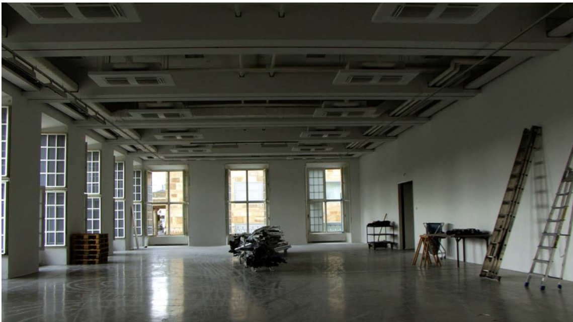
Mariam Ghani. Una breu història de ruïnes , 2011-12