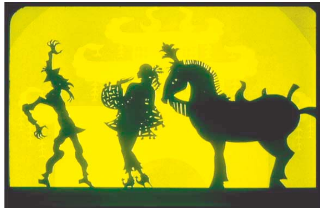
Die Abenteuer des Prinzen Achmed , Lotte Reiniger