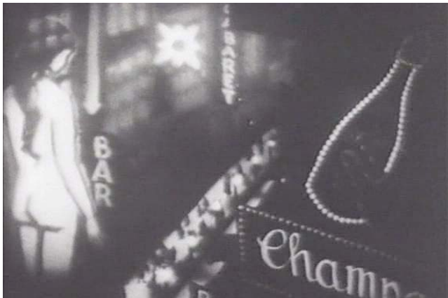
L'Idée , Berthold Bartosch