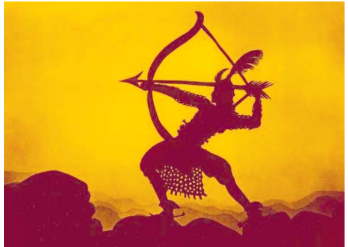
Die Abenteuer des Prinzen Achmed , Lotte Reiniger

El teatro de sombras y las siluetas: estas dos antiguas formas artísticas se reúnen en sus filmes. Durante toda su vida se abocó al teatro de sombras (e incluso escribió un libro al respecto). Y también hizo siempre siluetas, Cuando era una jovencísima alumna de interpretación se sentaba detrás del escenario, recortaba retratos de