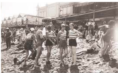
'Banyistes a la platja de Sant Sebastià'

produir la primera exposició antològica del fotògraf, al Centre de Cultura Contemporània de Barcelona