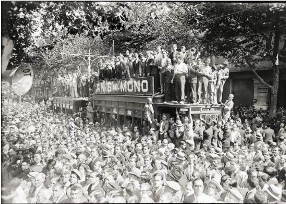
Festa de l'Onze de Setembre davant el monument de Rafael Casanova, el 1931