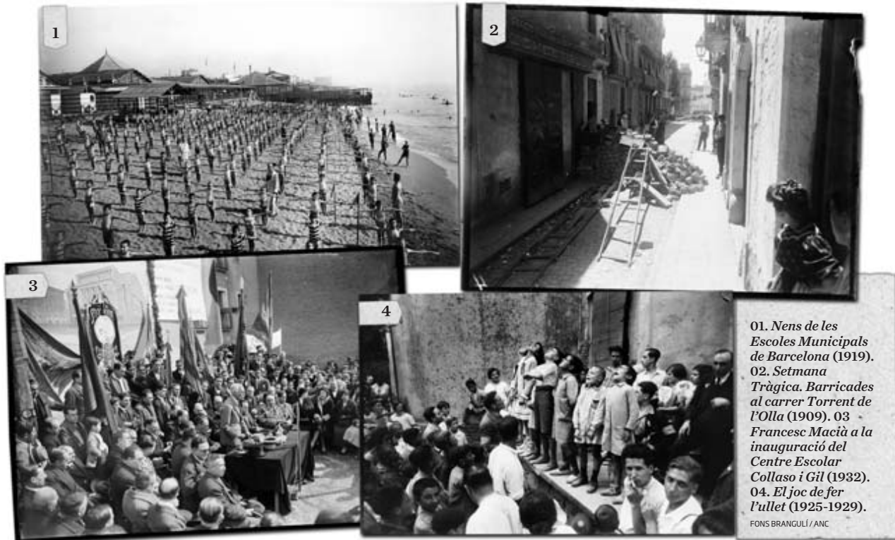
01. Nens de les Escoles Municipals de Barcelona (1919). 02. Setmana Tràgica. Barricades al carrer Torrent de l'Olla (1909). 03 - Francesc Macià a la inauguració del Centre Escolar Collaso i Gil (1932). 04. El joc de fer l'ullet (1925-1929).